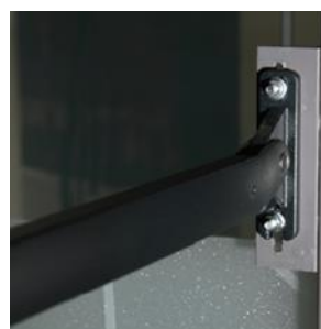
Armbeslag (her på vinkel)